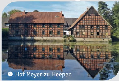
5 Hof Meyer zu Heepen