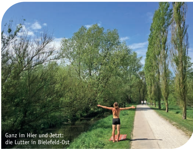
Ganz im Hier und Jetzt: die Lutter in Bielefeld-Ost