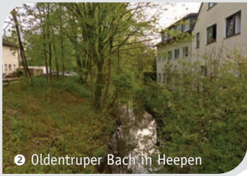
2 Oldentruper Bach in Heepen