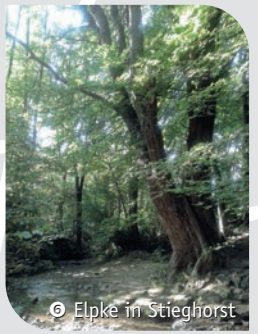
6 Elpke in Stieghorst