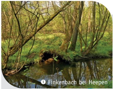
1 Finkenbach bei Heepen