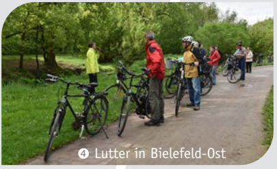
4 Lutter in Bielefeld-Ost