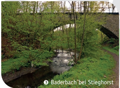
3 Baderbach bei Stieghorst